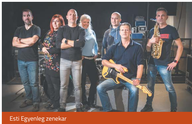
Esti Egyenleg zenekar

A négynapos fesztivál egyik legkülönlegesebb fellépése pedig a Hangária és a Filtol közös koncertje