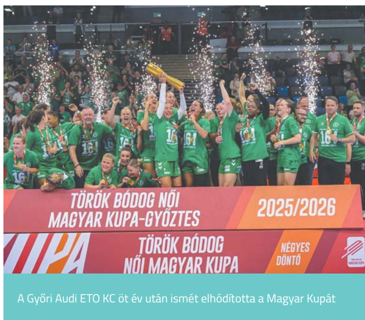
A Győri Audi ETO KC öt év után ismét elhódította a Magyar Kupát

A győri csapat sorozatban a 22. kupadöntőjében volt érdekelt, és 2021 után nézett farkasszemet ismét a fináléban a DVSC-vel, akkor 29–23-ra kerekedett felül. A győriek útja a kupagyőzelemig sem volt egyszerű: a szombati elődöntőben a sorozatot az elmúlt négy évben uraló Ferencvárost búcsúztatták, ezzel is jelezve, hogy újra visszatértek a hazai kupasorozat élére. A tatabányai négyes döntőben mutatott lehengerlő forma pedig azt üzeni: az ETO továbbra is meghatározó erő Európában és idehaza egyaránt.